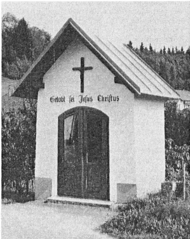
Kapelle des Hauses Fraundorf 1 erbaut 1856 von Johann Gahleitner renoviert circa 1980