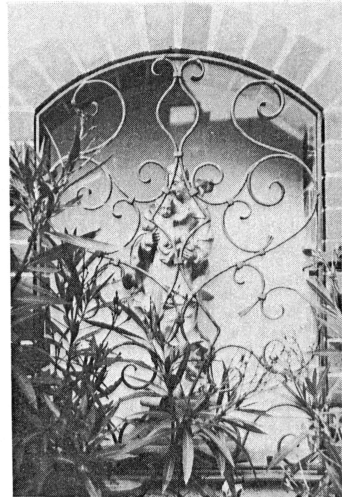
K a p e l l e

Anstelle der freistehenden Kapelle des Hauses Frindorf 5 wurde um 1980 eine Nische an der Außenmauer des Hauses gestaltet. Die Statue Maria mit dem Jesuskind stammt vom Bildhauer Ägidius Gamsjäger, Raffelding bei Eferding. Das schmiedeeiserne Gitter machte Heinrich Grill, Kunstschmied in Rohrbach.