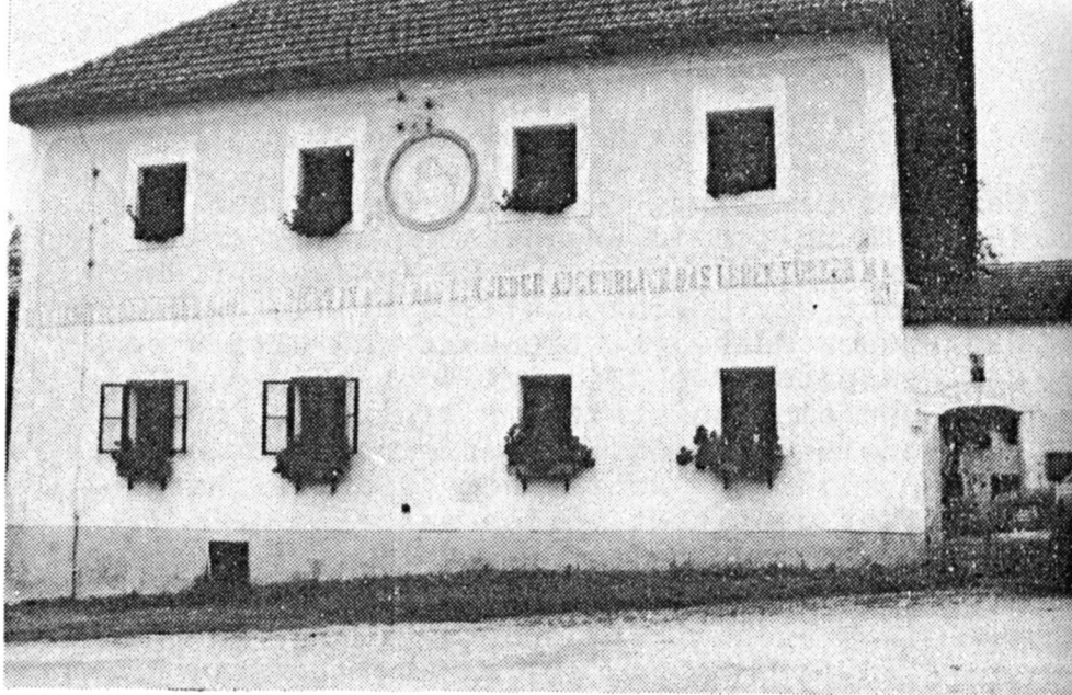
Hintring 2 (zur Inschrift vgl. S. 474)